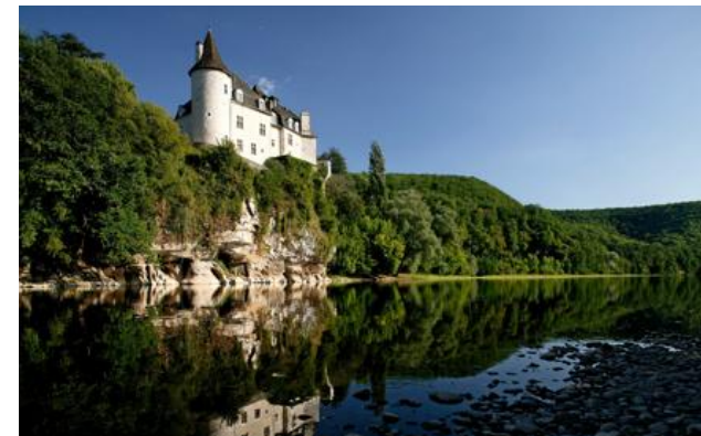
Membro Relais & Châteaux dal 1993 46200, Lacave (Lot)

Ristorante: pranzo dal martedì al sabato e mercoledì sera.