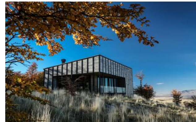
Membro Relais & Châteaux dal 2014 Estancia Tercerra Barranca s/n. Torres del Paine (Region de Magallanes)

Hotel e ristorante in montagna. Ritrovarsi solo, o quasi, di fronte agli spazi infiniti della Patagonia: Awasi Patagonia propone infatti un'esperienza unica nel suo genere. L'insieme di villette indipendenti sito in una riserva privata offre una totale intimità per ammirare la vista senza pari sulla foresta, il lago Sarmiento o le Torres del Paine. Ogni ospite ha assegnati una guida e una vettura, in modo da fargli scoprire al suo ritmo questi paesaggi grandiosi, osservare i condor, i guanachi e, chissà, fors'anche un puma. Quando il giorno volge alla fine si apprezza l'ambiente caldo del lodge principale e del ristorante, nonché il comfort delle ville, ispirate ai rifugi patagonici.