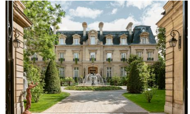
Relais & Châteaux Mitglied seit 2012 5 Place du Chancelier Adenauer 75116, Paris (Ile de France)